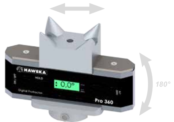
Der Kronenadapter ist seitlich verschiebbar. Doppelseitiger Einsatzbereich, 2 Positionsadapter vorhanden (drehbar um 180°).

Das Gerät ermöglicht, die Neigung des Querlenkers oder der Antriebswelle zur Waagerechten zu ermitteln. Die ermittelten Werte können zur weiteren Eingabe in elektronischen Achsvermessungsanlagen verwendet werden und dienen so zur Einstellung für Sturz, Spur und Nachlauf.