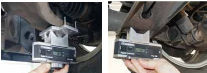
Anwendungsbeispiele (Messadapter ③ und Kronenadapter ①)