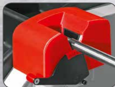
Schnelle Radmontage am Heber durch einfachen Hebelmechanismus.