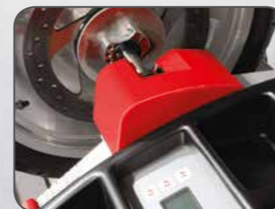
Die Radaufhängung am BikeBoss ist für kleine Rollerräder von 12 Zoll bis hin zu großen Enduro-Rädern von 21 Zoll.