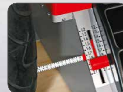
Genauere Eingabe und präzise Gewichte- platzierung mittels Maßband.