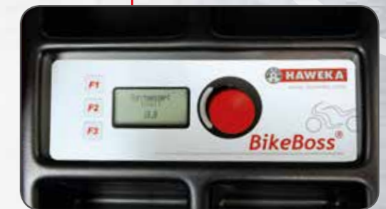
Das übersichtliche Display dient zur Eingabe der Rad- daten und zeigt an, wo am Rad die Auswuchtgewichte anzubringen sind.